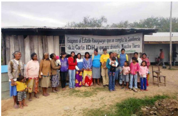
Caso Sawhoymaxa Indigenous v. Paraguay, 2006