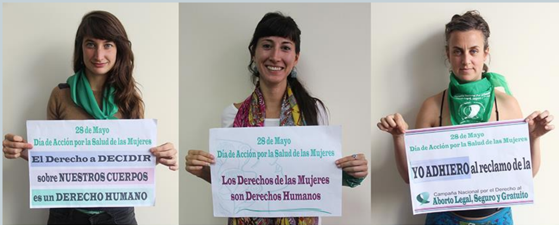
Primer Encuentro de la Red de Profesionales por el Derecho a Decidir | Mayo 2015