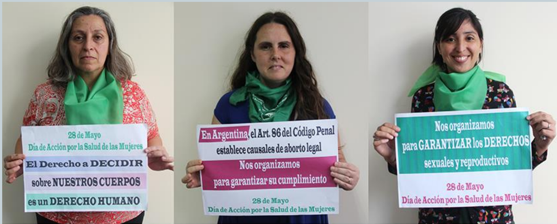
Primer Encuentro de la Red de Profesionales por el Derecho a Decidir | Mayo 2015