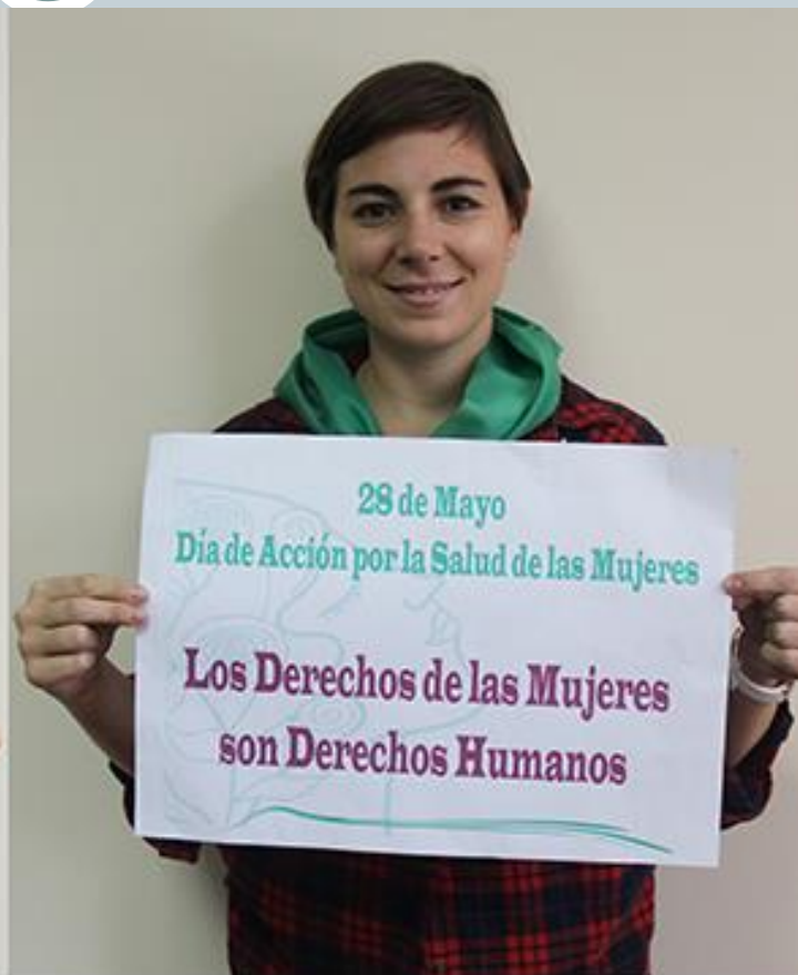
Primer Encuentro de la Red de Profesionales por el Derecho a Decidir | Mayo 2015