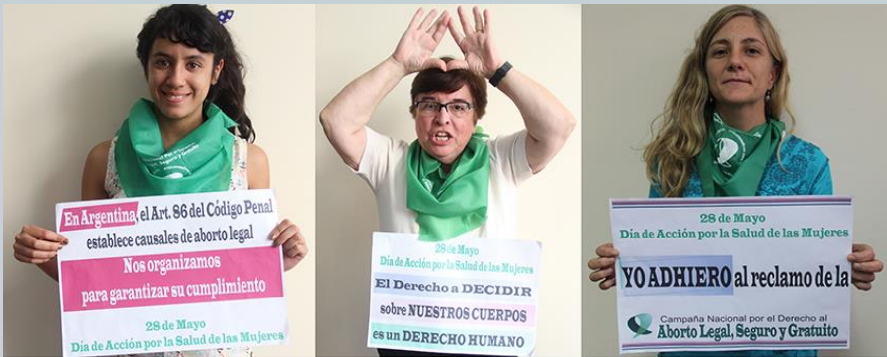
Primer Encuentro de la Red de Profesionales por el Derecho a Decidir | Mayo 2015