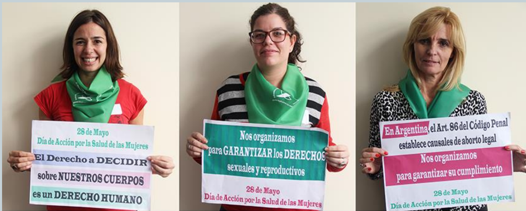
Primer Encuentro de la Red de Profesionales por el Derecho a Decidir | Mayo 2015