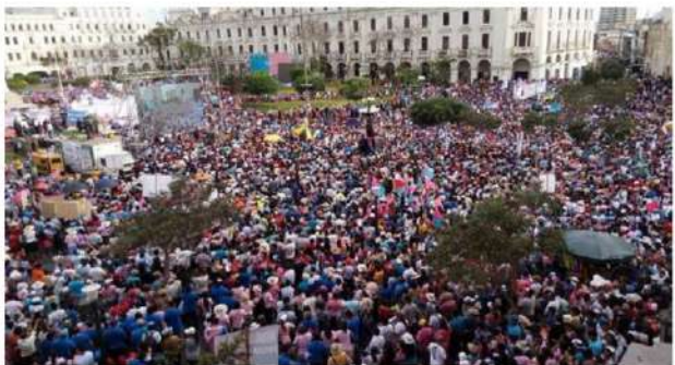
Imagen de la marcha en la Plaza San Martín donde hubo un millón al final de la jornada sabatina.