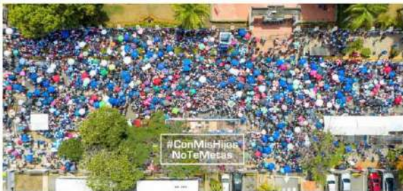
La marcha de Con Mis Hijos No Te Metas reunió a cientos en Santo Domingo.