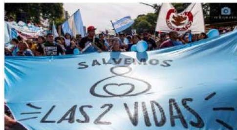
Contra el aborto. Con banderas de Argentina, los organizadores que se sublevaron 'pro vida' marcharon en diferentes puntos del país.