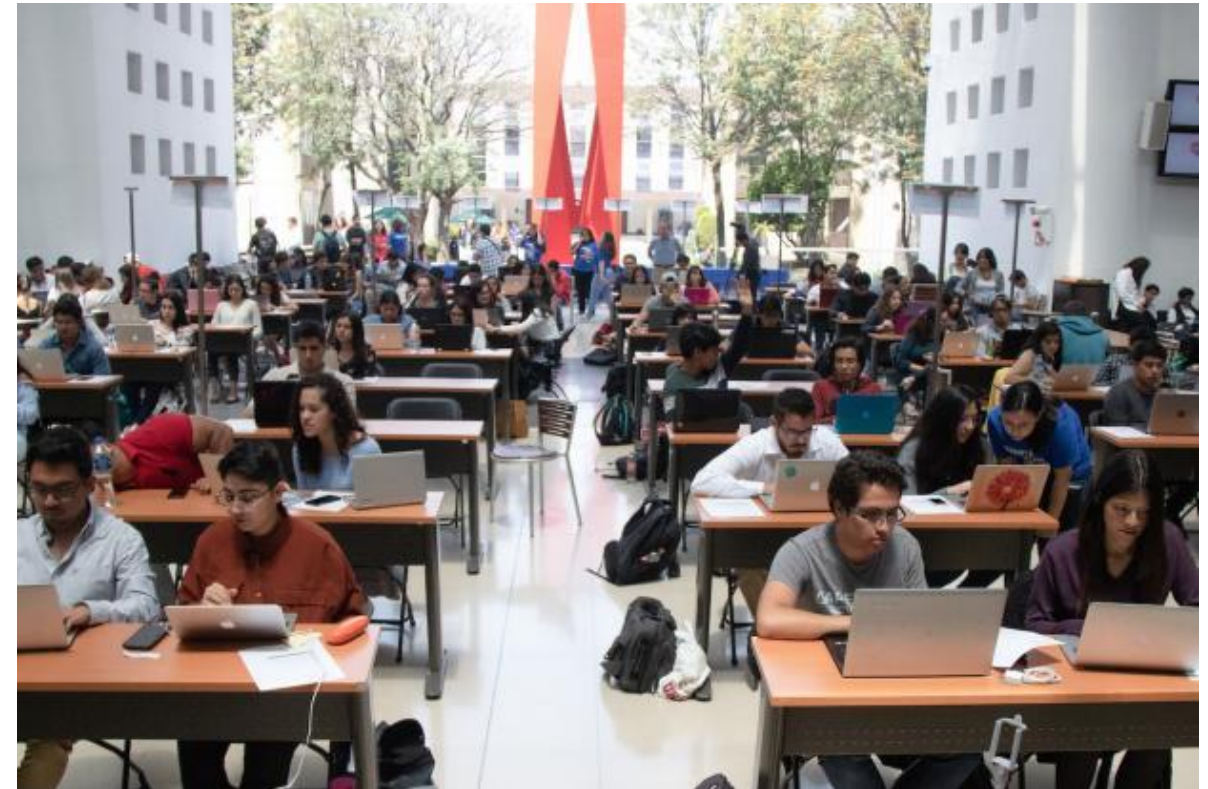
INNOVACIÓN TECNOLÓGICA México, BALANCE Y FÁCTICO , Ligue Político Plataforma web